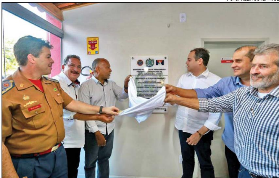
GOVERNADOR inaugurou a sede da 2ª Seção de Bombeiros, em Santa Maria da Boa Vista, que também atenderá Cabrobó, Orocó e Lagoa Grande

A unidade é vinculada ao 4º Grupamento de Bombeiros de Petrolina e atenderá ainda os municípios de Cabrobó, Orocó e Lagoa Grande. “Esse é um investimento dentro da política do Pacto Pela Vida, de ter serviços funcionando cada vez mais próximos da população. A Seção dos Bombeiros, inaugurada hoje, é fruto de uma parceria com o município, em um investimento de mais de R$ 1,5 milhão, com os equipamentos, que já estão devidamente instalados e com todo material humano. Essa é mais uma ação em favor da população, do resgate, do salvar vidas. É