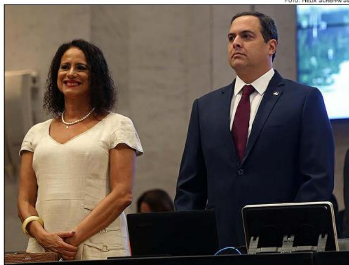
LUCIANA SANTOS E PAULO CÂMARA iniciam, hoje, um novo Governo no Estado